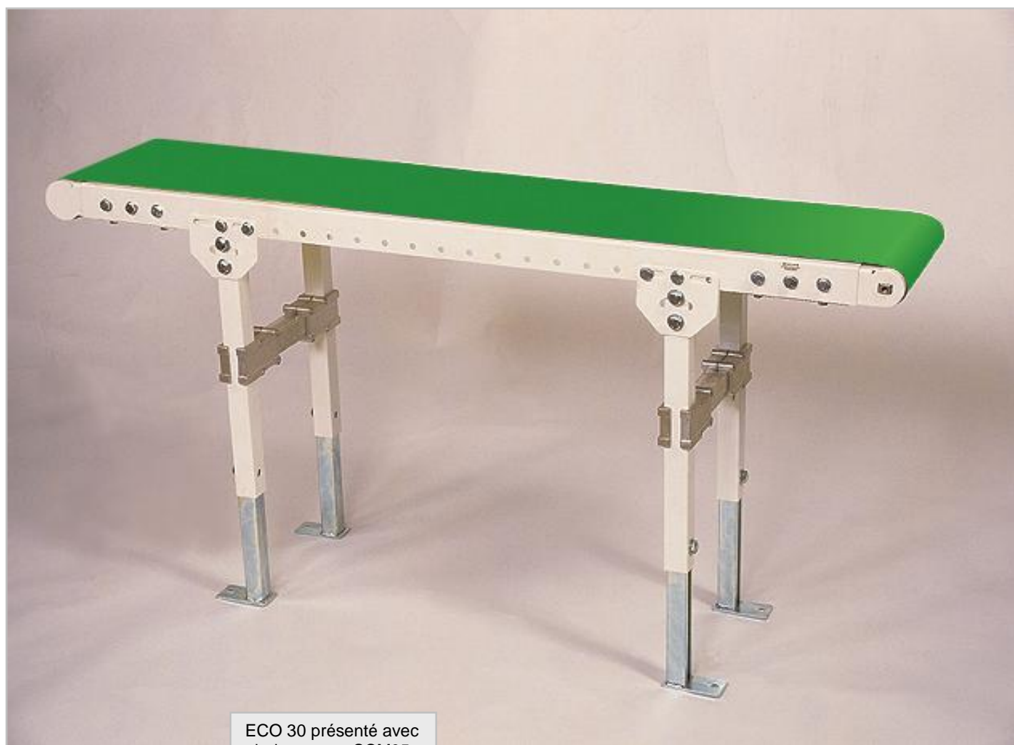
ECO 30 présenté avec pieds support SCM05. RAL 9010

L'entraînement de la bande est effectué par un tambour moteur.