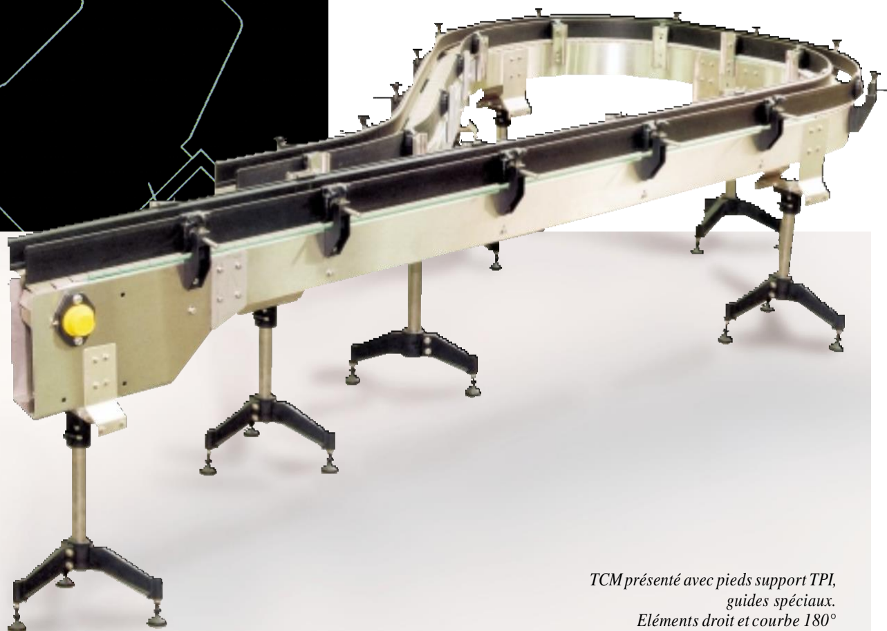
TCM présenté avec pieds support TPI, guides spéciaux. Eléments droit et courbe 180°

Transporteur à chaîne palette biplan pour charges jusqu'à 20 kg/m.