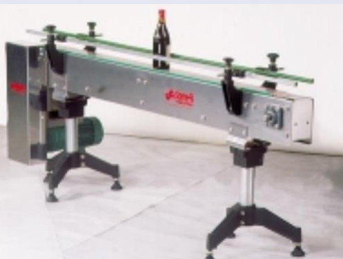
TCM élément droit avec carter de protection moteur