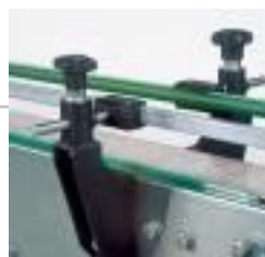
Guides bilatéraux H : 64