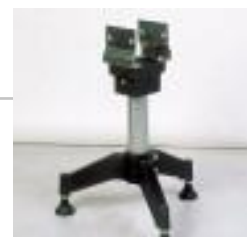
Pied support TPI