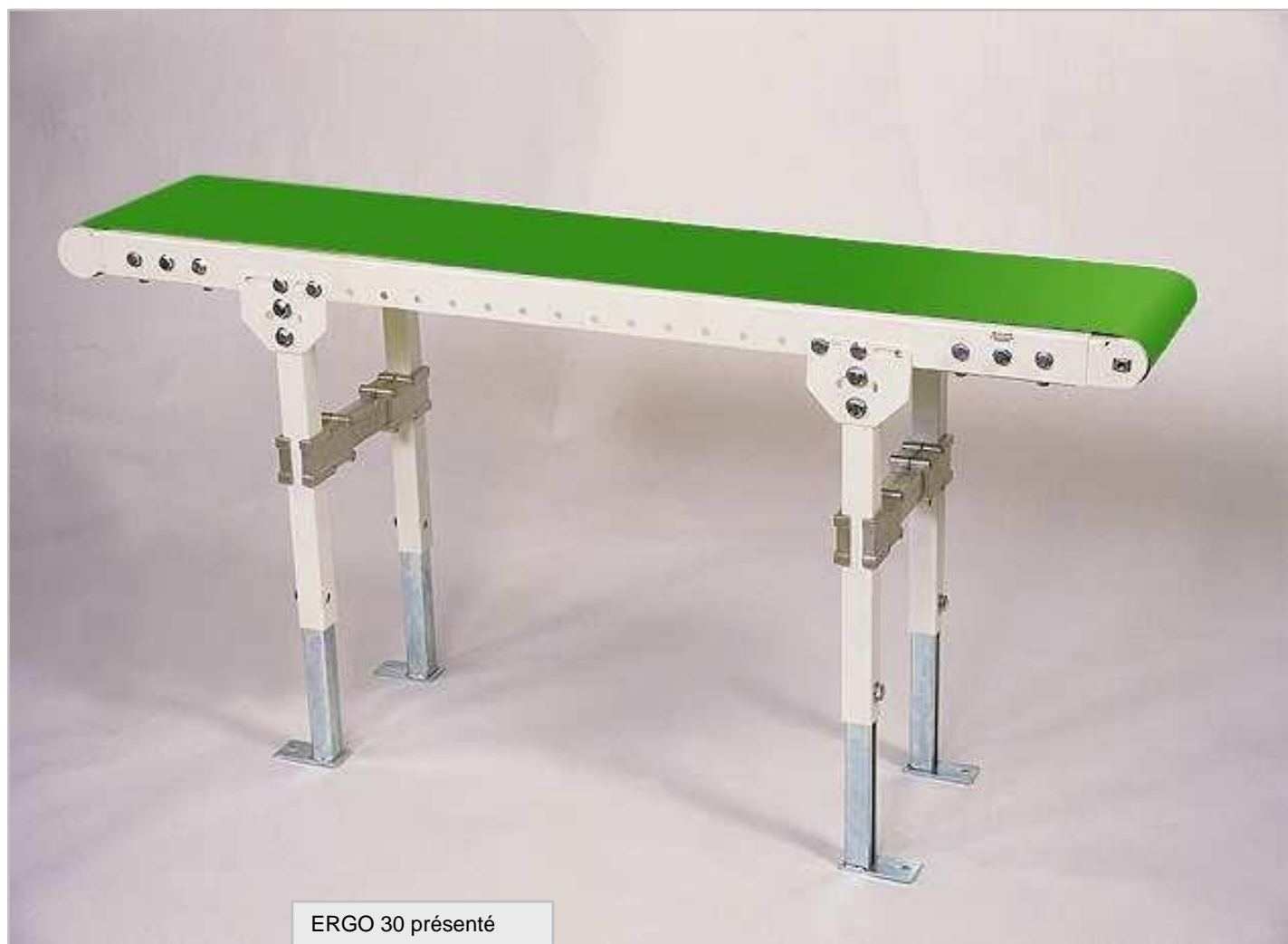
ERGO 30 présenté avec pieds support SCM05. RAL 9010

L'entraînement de la bande est effectué par un tambour moteur.